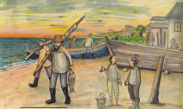
2 Solfegiu – mică piesă muzicală fără cuvinte

Și uite așa, fie noapte, fie zi, primea Dumnezeu laudă din satul pescăresc, primea cântare de bucurie și de recunoștință pentru viața de El dăruită tuturor.